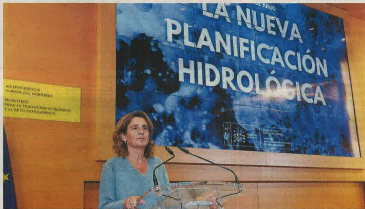
Ribera consideró necesario contar con caudales ecológicos que garanticen la protección de los ríos.

8.000 MILLONES. Algo «imposible de acometer si no invertimos», de manera que avanzó una inversión de hasta 8.000 millones de euros solo desde la Administración General del Estado, para los