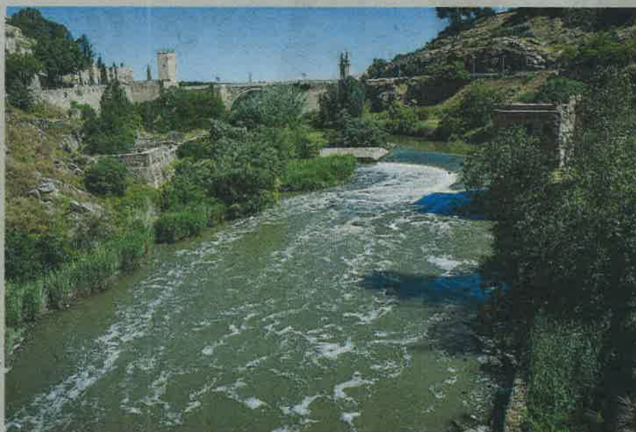
El Tajo a su paso por Toledo.