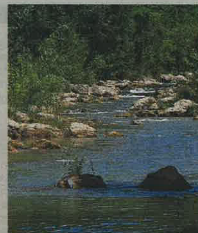
Río Júcar a su paso por Cuenca.