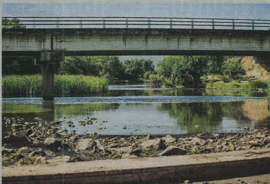
El río Guadiana adolece de una crónica falta de caudal.

cúbicos y que eso «nos permitiría regular pozos». Además cree que esta regulación ayudará a recargar los acuíferos. También confía en que se podrá aumentar esa recarga con la inversión de la Tubería Manchega, que supone una inyección de 50 hectómetros cúbicos del Tajo. El consejero expuso que se ha incluido una inversión de cincuenta millones para esta infraestructura y calcula que el primer tramo podría entrar en funcionamiento a principios del año que viene, consiguiendo los primeros diez hectómetros cúbicos de los cincuenta posibles.